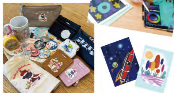
プロのイラストレーターとデザイナーが、お子さま一人ひとりの思い描くイメージを大切にしながらサポートします。オリジナル作品づくりを通して、「Procreate」の使い方を実践的に指導します。