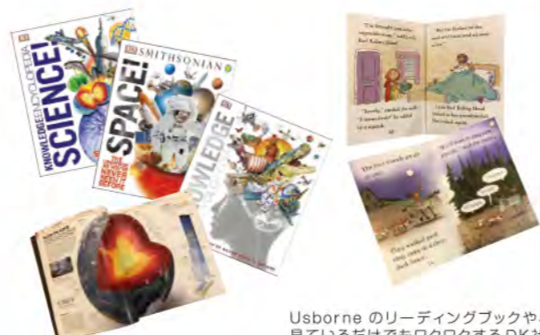
Usborneのリーディングブックや、見ているだけでもワクワクするDK社の図鑑や事典が勢揃いしています。